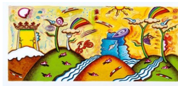
Immagine gentilmente concessa dall'artista Giuliano Ghelli